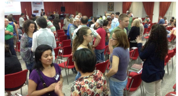
Insieme per crescere